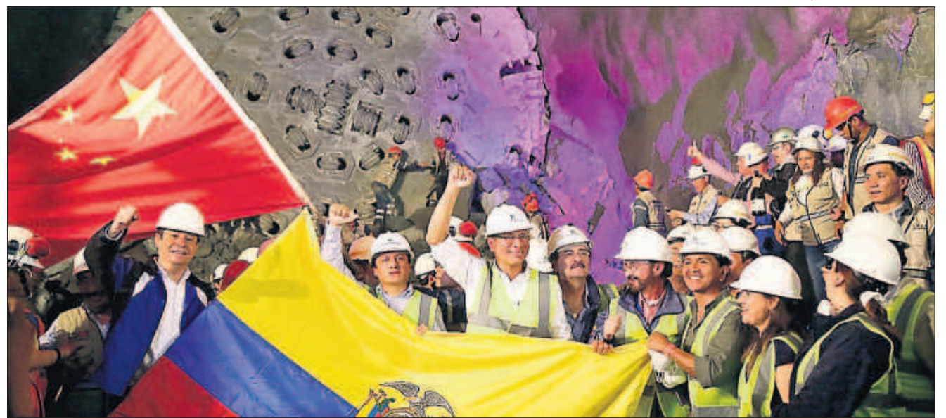
• En enero, los funcionarios de Gobierno celebraron la terminación de una parte del túnel de conducción de la central.

En contexto Para la construcción del proyecto hidroeléctrico, el Eximbank de China otorgó al Ecuador un crédito por USD 1 682 millones en el 2010, al 6,9% de interés y un plazo de 15 años. En el proyecto han laborado 7 898 trabajadores: 80,7% nacionales y 19,3% extranjeros.